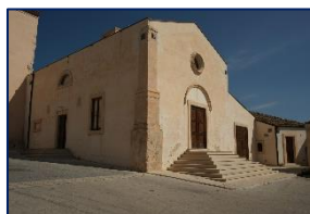
Sala della Sciabica